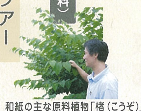
和紙の主な原料植物「楮(こうぞ)」

今から八百年前、戦いに敗れた平家の一団が人家の少ない山間に身を隠し、紙を作り始めました。その後この地は「黒谷」と呼ばれるようになり、江戸時代、地域を納めた山家藩の藩主が京の都の呉服屋に黒谷の紙を売り込んだ事から、都でも使われる様になり、和紙産地として発展しました。現在では国内の他、海外にも輸出され、アートの現場や、絵画の修復で使う材料など、さまざまな用途で使われています。