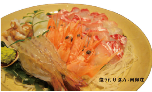
盛り付け協力: 南海荘