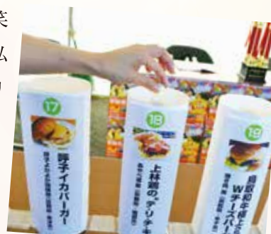
投票用ビー玉。「テ・リ・チ・キ」に一票！