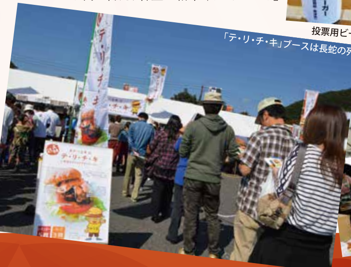
「テ・リ・チ・キ」ブースは長蛇の列

の順位は…堂々の10位入賞（^o^）／数々の有名バーガーがひしめく中、初参加でこの結果は大健闘だと感じます。綾部の名前も大いに全国へPRされたのではないのでしょうか。皆様も綾部にお越しの際はぜひ、あやべ温泉で「全国トップ10入り」のご当地バーガーを味わってみてください！！